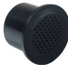
Угольный фильтр - FILTRE1 Рекомендуется менять ежегодно

*Максимальная вместимость рассчитана для бутылок Бордо 0,75 л при наличии 4 полок. Добавление полок значительно уменьшает общую вместимость