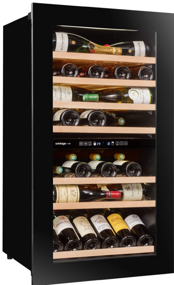
Модель AVI76PREMIUM оснащена полкой для презентаций в нижней части корпуса.