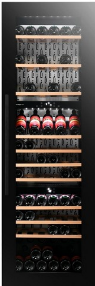
Модель с полностью стеклянной дверью и черной ручкой